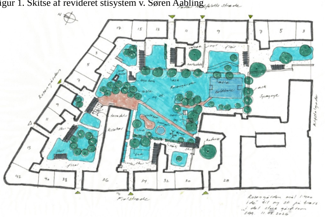
Figur 1. Skitse af revideret stisystem v. Søren Aabling

Dele af den nye "skråsti" indbefatter passagen fra gyngestativet hen mod Kastanjegården der grundet flittig trafik, i dag henlægger som 'muddersti' i regnfulde perioder (se Figur 2) og 'skøjtebane' når frosten fænger. En reel, grusbelagt sti vil derfor øge sikkerheden for alle der færdes ad denne vej.