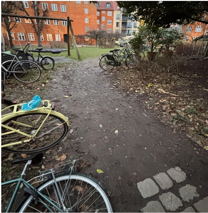
Figur 2. Foto af 'muddersti' som ønskes omlagt med grus som del af den foreslåede 'skråsti'

Den del af den nuværende 'midtersti' som fører gennem 'Børneskoven' foreslås bevaret, men henført – som oprindeligt planlagt af Tegnestuen Steen Eiler Rasmussen (se Figur 3) - med udløb ved det nordvestlige hjørne af boldbanen og ikke som i dag, midt på gavlen af Fiolstræde 28A. Alternativt droppes den helt og overlades til naturens gang.